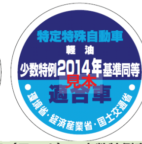
オフロード法 2014年基準適合表示（ラベル）、少数特例表示（ラベル）