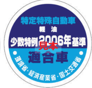
オフロード法 2006年基準適合表示（ラベル）、少数特例表示（ラベル）