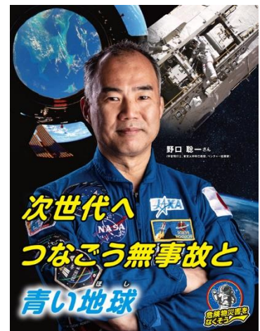
消防庁／都道府県／市町村／全国消防長会／一般財団法人全国危険物安全協会 危険物安全週間推進ポスター