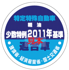
オフロード法 2011年基準適合表示（ラベル）、少数特例表示（ラベル）