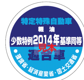
オフロード法 2014年基準適合表示（ラベル）、少数特例表示（ラベル）