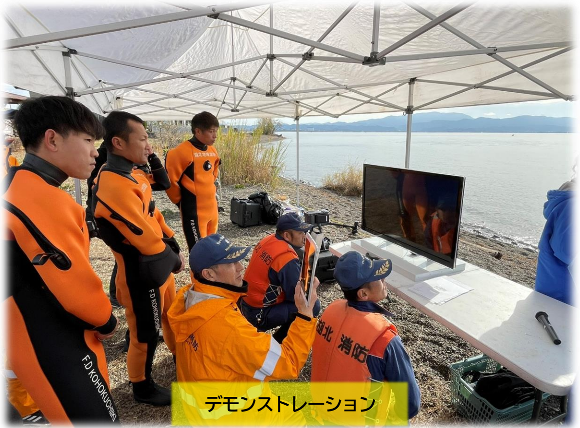
デモンストレーション